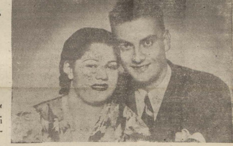
Katil ve sevgilisinin bir arada çekilmiş resimleri

Babası Emniyet Sandığı veznedarlığından emekli Mehmed Rıza Birara, halî ticaretle de iştigal olmuş, ailesini oldukça müreffeh yaşatabilecek bir ser-