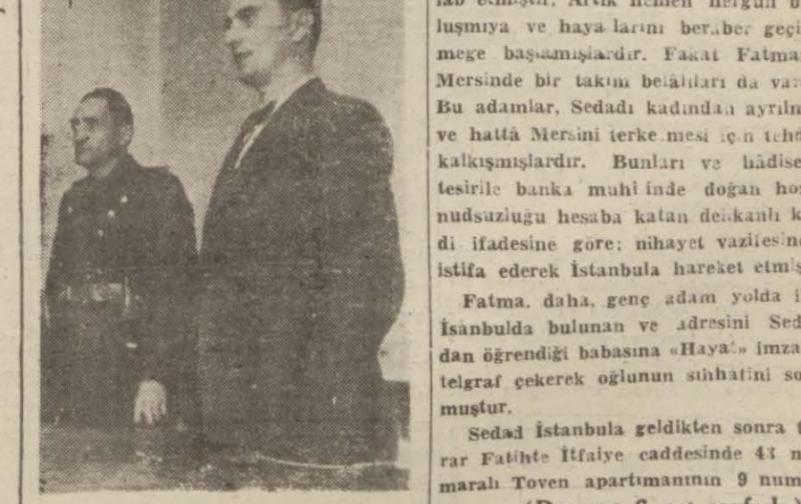
Katil hâkim huzurunda

Burada da ilk aylarını mazbut bir hayat sürmekle geçiren Sedat, nihayet