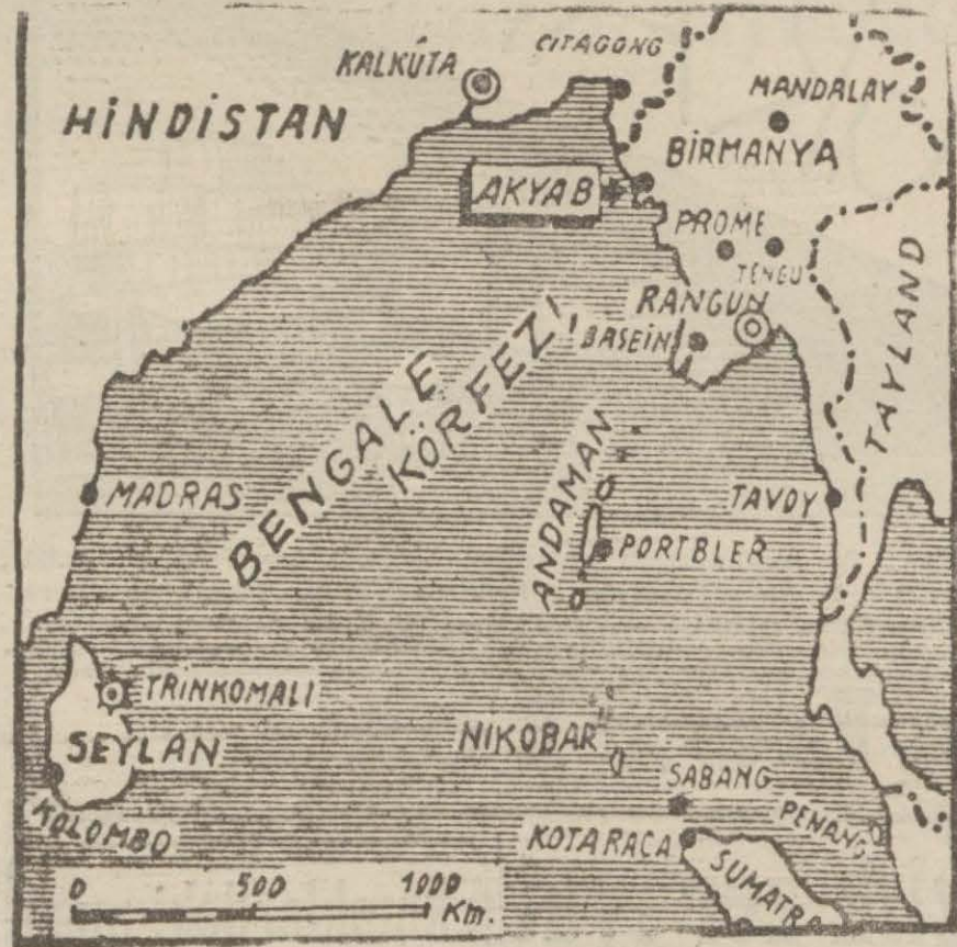
Seylan adasını gösterir harita

Azad kararlarını yarın gece neşredebileceğini bildirmiştir.